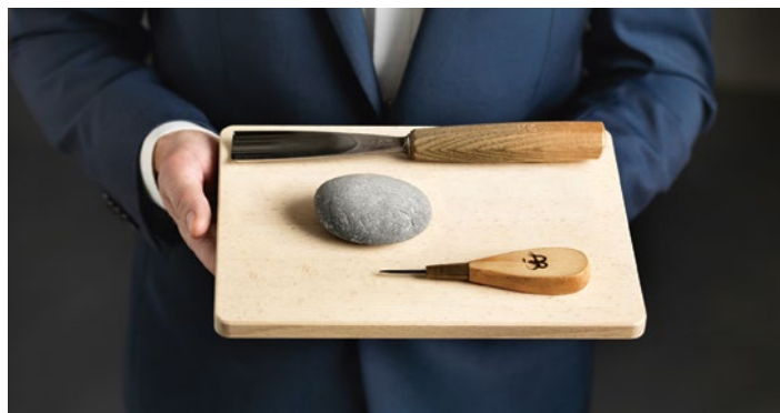
Mit dem SZKB Fondssparplan können Sie regelmässig einzahlen und in die Finanzmärkte investieren.

Ob Strategiefonds, Ethikfonds, Indexfonds oder Aktien- und Dividendenfonds mit 100%