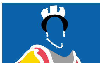
«Die Royals kommen» heisst die aktuelle Ausstellung in Schwyz.

Dank der Partnerschaft der SZKB mit dem Forum der Schweizer Geschichte in Schwyz profitieren Kundinnen und Kunden das ganze Jahr von kostenlosem Eintritt.