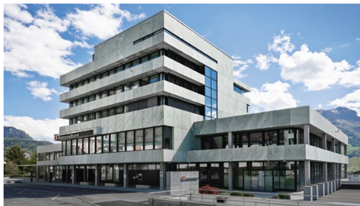
Aus dem Geschäftsjahr 2020 resultiert eine Gewinnausschüttung von CHF 47.1 Mio. an den Kanton Schwyz.

Die Kundenausleihungen setzten ihren kontinuierlichen Wachstumspfad fort. Das Depotvolumen erreichte eine neue Rekordmarke. Die starke Eigenkapitalbasis