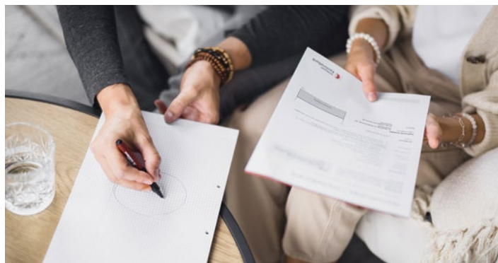
Ein Mix aus Festhypothek und Rollover-Finanzierung bietet Flexibilität und Sicherheit.

Die Finanzierung Ihres Eigenheims lässt sich in mehrere Tranchen aufteilen. Dies erlaubt es Ihnen, Hypothekarform und -laufzeit auf Ihre Bedürfnisse anzupassen. Besonders vorteilhaft ist ein Mix aus Festhypothek und Rollover-Finanzierung: Die Festhypothek bietet Ihnen eine stabile, gut kalkulierbare Basis. Sie vereinbaren für eine bestimmte Laufzeit einen festen Zinssatz, der unabhängig von Marktschwankungen bleibt. Dies gibt Ihnen die nötige Planungssicherheit.