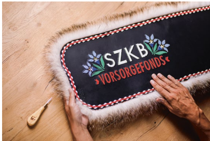
Mit den SZKB Vorsorgefonds erhöhen Sie Ihre Renditechancen.

Setzen Sie auf die Kompetenz und die taktischen Anlageentscheidungen der SZKB-Experten und investieren Sie in unsere aktiv verwalteten Fonds-Strategien (SZKB Strategiefonds Vorsorge / SZKB Ethikfonds Vorsorge). Oder koppeln Sie Ihre Anlage