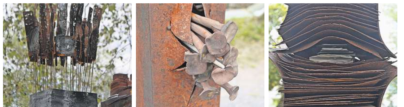
Sibylle Schindler (rechts) erklärt Passantinnen ihre Stelen (Bild oben). Die Details der Zeitzeugen zeigen unten (von links), der fröhliche Haarschopf eines Kindes, die erlebte Gewalt und das Keimen der Hoffnung.

ders», betont Sibylle Schindler. Und sie weist auf die von aussen völlig getarnte Solarbeleuchtung hin: Nachts entfaltet die Gruppe am Fluss eine nochmals andere Wirkung.