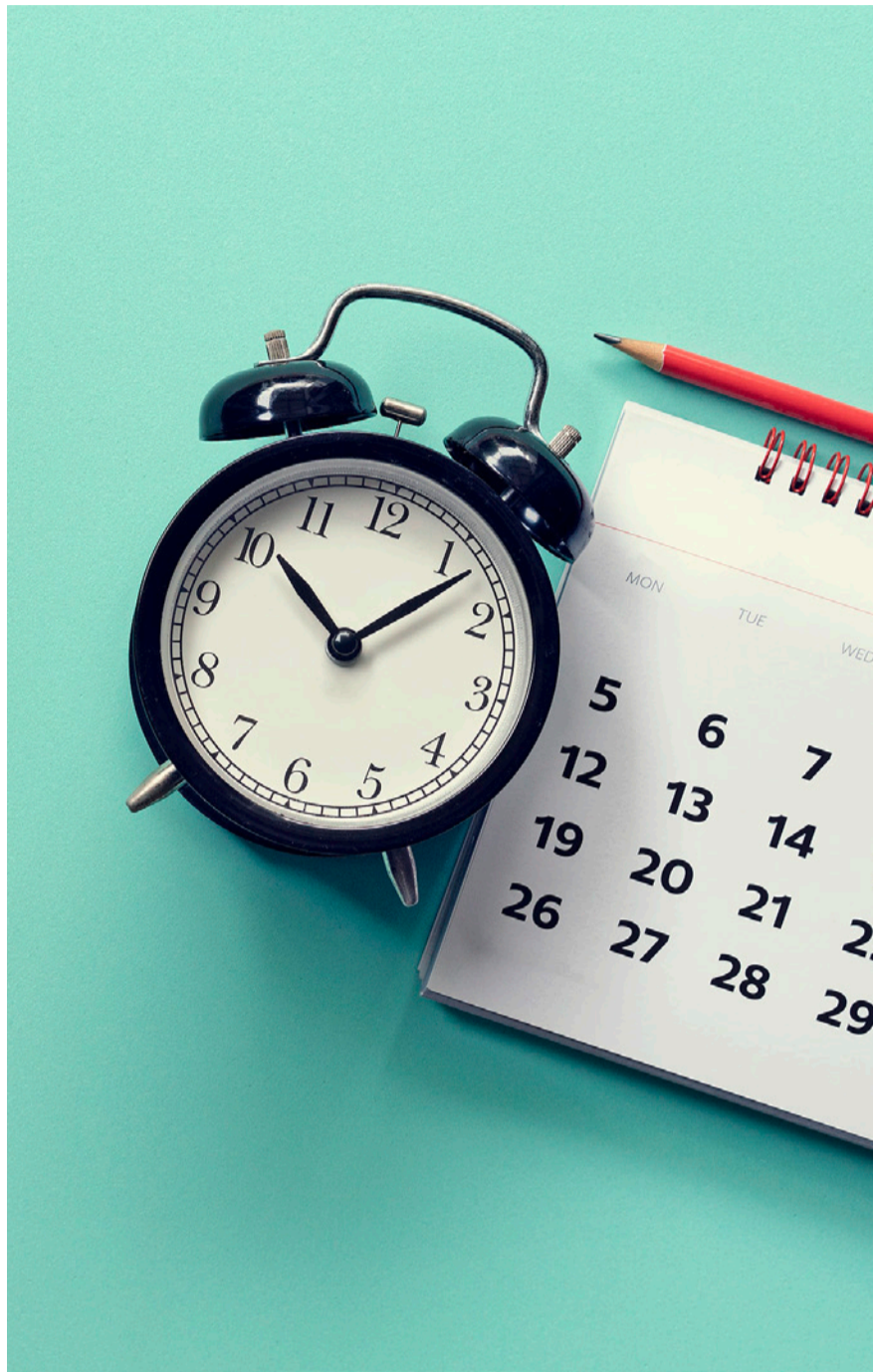
Beim Investieren in die Vorsorge zählt die Regelmässigkeit der Einzahlungen.

Inzwischen bieten Banken und Versicherungen eine stattliche Palette an 3a-Vorsorgefonds mit unterschiedlichen Strategien an. Im ökologisch-sozialen Sinne ist nachhaltiges Investieren gerade en vogue. Die Wahl der jeweiligen Anlagestrategie ist stets von der individuellen Risikoneigung abhängig. Der tendenziell längere Anlagehorizont erlaubt aber einen höheren Ak-