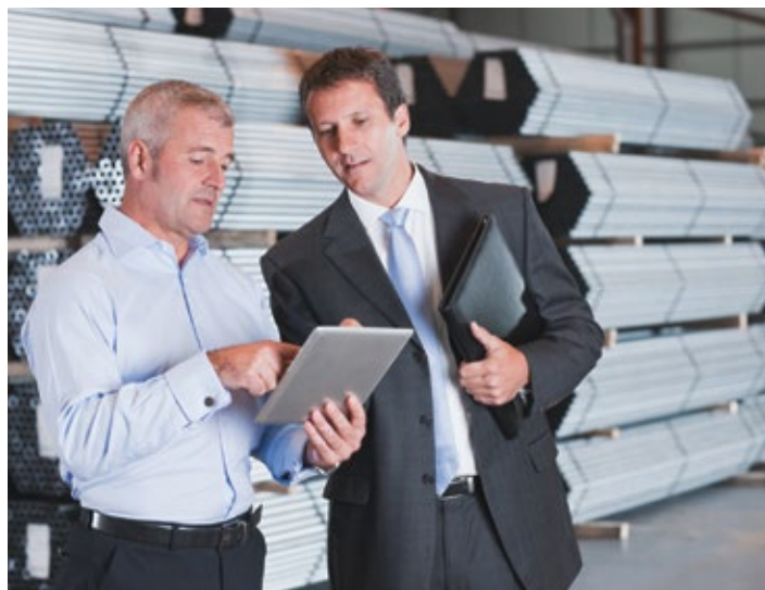
Der KMU Rahmen bietet finanzielle Beweglichkeit nach Mass.

Für kleinere Unternehmen bietet der KMU Rahmen den Vorteil,