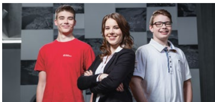
Die Schwyzer Kantonalbank bietet Lehrstellen in verschiedenen Bereichen.