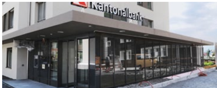
Die neue SZKB-Filiale Muotathal

Seit dem 10. Juni können die Kundinnen und Kunden in Muotathal in einer neuen Filiale begrüsst werden. Der Neubau im Schachenmattli besticht durch eine grosszügige, moderne Einrichtung. Die helle und einladende Schalterhalle bietet viel Platz, und für die persönliche Beratung steht ein Sitzungszimmer zur Verfügung. Dank eines Bancomaten und eines Einzahlers sind Bankgeschäfte rund um die Uhr möglich. Auf telefonische Voranmeldung werden