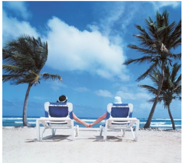
Mit unseren Reisezahlungsmitteln geniessen Sie stressfreie, unbeschwerte Ferien.

Unser Tipp für Europareisen: Beziehen Sie vor Ihrer Reise kostenlos Euro an unseren Bancomaten. Damit sind Sie nicht nur unabhängig von unseren Banköffnungszeiten, sondern erhalten auch einen bevorzugten Wechselkurs.