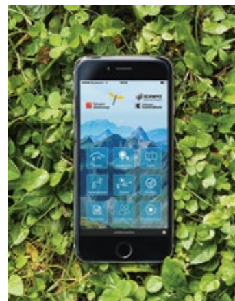
Die von der Schwyzer Kantonalbank unterstützte Wander-App.

Beim Jubiläumprojekt «Perspektivenwechsel» erhielten alle Mitarbeitenden der SZKB die Möglichkeit, einen Tag Freiwilligenarbeit zu leisten. Rund 350 Mitarbeitende engagierten sich in verschiedensten Projekten. Hier eine kleine Auswahl: Einsatz im Altersheim Abendruh Ibach, Unterhaltsarbeiten am Wanderweg Silberer, Mithilfe bei Sportanlässen, Seeräumung in Brunnen oder Schlagholzräumung im Schletterwald.