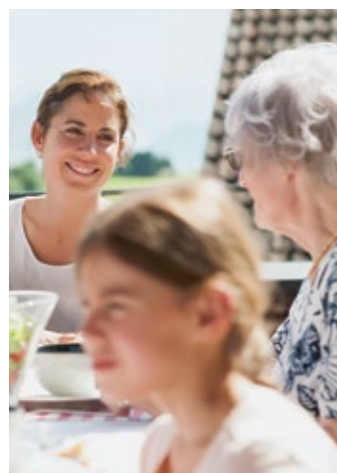
Dank mehrerer Sparen3-Konten können Steuern gespart werden.

Setzen Sie mit Ihrem Vorsorgekonto Sparen 3 zum Schlusspurt des aktuellen Jahres an und optimieren Sie Ihre Steuerrechnung 2015. Bis zum Ende des Jahres dürfen Sie folgende Höchstbeiträge einzahlen und vom steuerbaren Einkommen abziehen: Erwerbstätige mit Pensionskasse: CHF 6'768, Erwerbstätige ohne