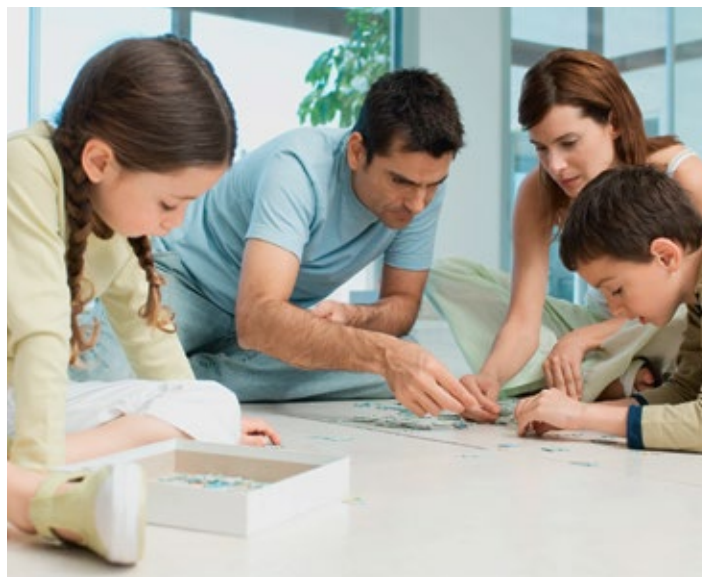
Das Basis-Set der SZKB bietet ein Rundum-Angebot.

Inbegriffen sind ebenso sämtliche unserer Sparkonten – je nach Lebensphase und Bedürfnis ha-