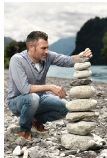
Die SZKB Ethikfonds vereinen finanzielle und ethische Ansprüche.

Empirische Analysen belegen, dass nachhaltige Kapitalanlagen gegenüber konventionellen Investitionen keinen Renditenachteil aufweisen. Im Gegen-