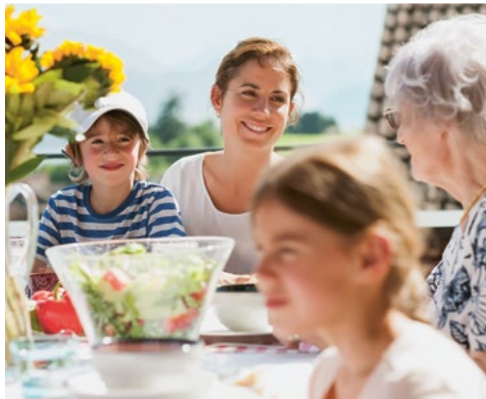
Mit der Säule 3a können Sie jedes Jahr Steuern sparen.

Entscheiden Sie sich deshalb jetzt für ein Sparen 3-Konto und optimieren Sie Ihre Steuerrechnung 2016. Bis zum Ende des Jahres dürfen Sie folgende (gesetzlich festgelegten) Höchstbeträge einzahlen und vom steuerbaren Einkommen abziehen: