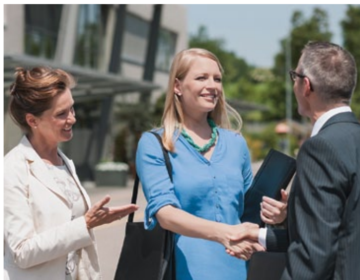
Die SZKB hilft bei der Erstellung eines Businessplans.

Der Businessplan hilft Neuunternehmern dabei, durch eine strukturierte Planung eine solide Orientierungsstütze für den unternehmerischen Start zu erhalten. Für bestehende Unternehmerinnen und Unternehmer lohnt