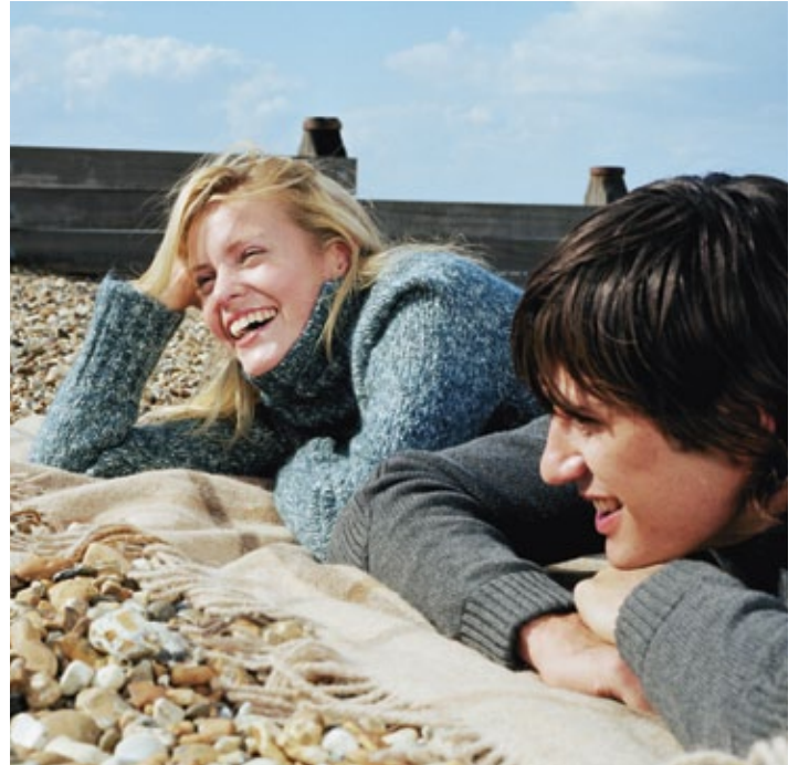
Das Konto Bildung plus bietet Studierenden zahlreiche Vorteile.

Mit dem Konto Bildung plus gewähren wir Ihnen nicht nur einen attraktiven Vorzugszins und eine spesenfreie Kontoführung – mit der kostenlosen Maestro-STUcard können Sie jederzeit Bargeld auf der ganzen Welt beziehen und Ihre Einkäufe tätigen. Zudem kommen Sie in den Genuss von zahlreichen Vergünstigungen in den angesagtesten Geschäften, Clubs und Restaurants.